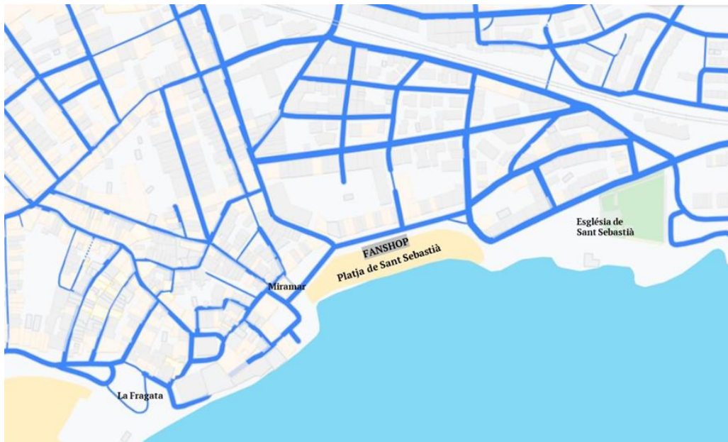
Esquema gràfic de la ubicació de l'espai FANSHOP.

No obstant l'anterior, serà obligació de cadascun dels venedors proveir la il·luminació de la seva parada, sempre amb bombetes de baix consum de tipus led i un cablejat adequat, sense entroncaments ni altres que posin en perill el subministrament.