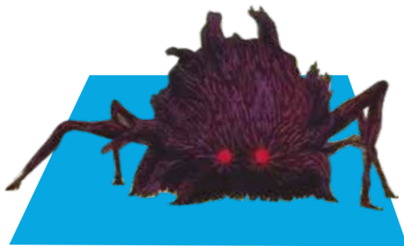
Déu Porc-senglar (La princesa Mononoke)

El protagonista d'aquesta fantàstica història d'aventures és un pilot veterà de la Primera Guerra Mundial, en Marco Pagot, que rep un cap de porc per culpa d'una maledicció, el qual li val el sobrenom de Porco Rosso. Sota aquesta nova forma, es dedica a capturar pirates aeris, fins que aquest treball el porta a lluitar contra l'exèrcit nazi. Malgrat tot el que li ha passat, el Porco accepta amb orgull la seva nova forma, com evidencia la seva popular frase: "Prefereixo ser un porc a un feixista".