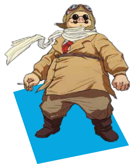
Porco Rosso (Porco Rosso)

La protagonista d'aquesta sort d'òpera infantil és una nena d'origen màgic, meitat humana i meitat peix, la qual comença a canviar de forma en trobar-se amb el protagonista, en Sosuke, un nen que viu amb la seva mare en una casa vora el mar. La Ponyo té tota classe de poders misteriosos, els quals haurà de posar a prova per protegir a en Sosuke i ajudar-lo a trobar a la seva mare quan un tsunami impacti el poble i provoqui una inundació. Les seves diverses mutacions la fan una de les criatures més cuquis de l'univers Miyazaki.