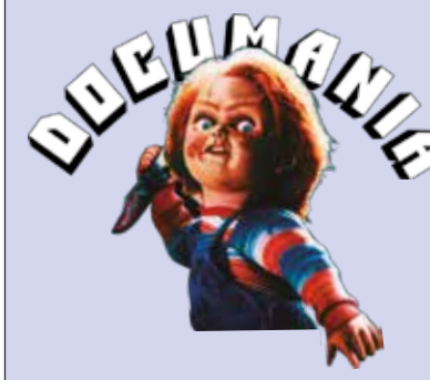
LIVING WITH CHUCKY

Tras su paso por Cannes, llega a Sitges la propuesta de Tae-gon Kim, que fusiona cine de catástrofes y monster movie, llevando a una jauría de perros mutantes a hacérselo pasar fatal a los supervivientes del derrumbe de un puente.