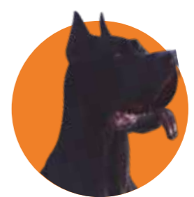
PROJECT SILENCE (2023)

Basada en la misma novela de Alberto Vázquez-Figueroa que dio origen a El perro de Isasi-Isasmendi, nuestra querida Fantastic Factory apostó por un relato distópico a lo 1997: Rescate en Nueva York , con un perro-ciborg asesino.