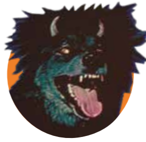
DEVIL DOG: THE HOUND OF HELL (1978)

El perro terrorífico con el mejor nombre de la historia, Zoltan, un can que acompaña a un cruel vampiro con los rasgos del gran Michael Pataki. Esta película, además, contiene la mejor resurrección vampírico-perruna de la historia.