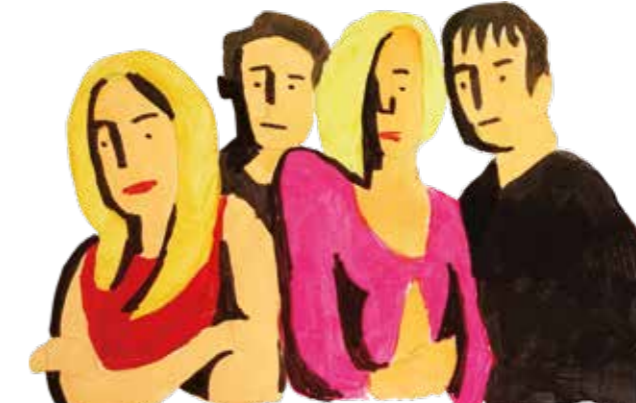
THE IN CROWD (2000)