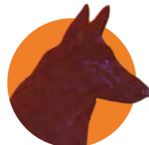
LA CRIATURA (1977)

Desde resultados de experimentos imposibles a perros infernales, pasando por metáforas del franquismo y críticas raciales. A raíz de la llegada de la coreana Project Silence , en la que unos perros mutantes atacan a los supervivientes de una catástrofe en un puente, recuperamos algunos de los canes más icónicos (que no adorables) del cine.