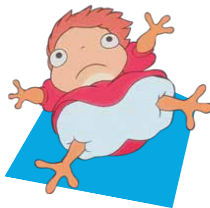
Ponyo (La Ponyo al penya-segat)

En una escena d'aquesta deliciosa pel·lícula, en Totoro i les nenes protagonistes es troben amb aquest felí en forma d'autobús, el qual pot arribar ràpidament a qualsevol lloc gràcies a la velocitat que li proporcionen les seves deu potes. A més d'estar inspirat per una criatura del folklore japonès, el bakeneko (un yokai que sovint pren la forma d'un gat), el seu somriure referència al Cheshire, en una de nombroses referències a Alicia al país de les meravelles a l'obra del cineasta nipó.