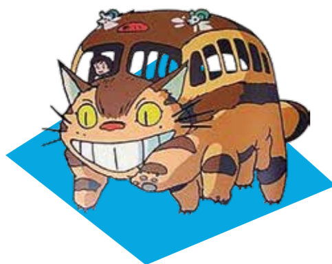
Gatbus (El meu veí Totoro)

En una escena d'aquesta deliciosa pel·lícula, en Totoro i les nenes protagonistes es troben amb aquest felí en forma d'autobús, el qual pot arribar ràpidament a qualsevol lloc gràcies a la velocitat que li proporcionen les seves deu potes. A més d'estar inspirat per una criatura del folklore japonès, el bakeneko (un yokai que sovint pren la forma d'un gat), el seu somriure referència al Cheshire, en una de nombroses referències a Alicia al país de les meravelles a l'obra del cineasta nipó.