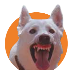
EL PERRO BLANCO (1982)

Curtis Harrington, siempre punzante, utilizó esta notable tv-movie para mostrar una secta satánica en el terreno idílico de una zona residencial americana, custodiada por un perro con muy malas pulgas que huele a azufre.