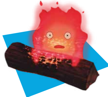
Calcifer (El castell ambulat)

Candidat ferm al monstre més terrorífic de tota l'obra d'en Miyazaki, el Déu Porc-senglar és un ésser màgic dels boscos, el qual és infectat per un dimoni, que el torna agressiu: el seu aspecte negre és el que li donen els cucus que poblen les seves ferides en cobrir-lo per complet, excepte pels seus ulls vermells. La seva aparició a l'inici del film deixa clar que ens trobem amb una de les obres més fosques d'estudi Ghibli, amb un argument per adults i un final tan profundament estrany com inquietant.