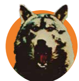
EL PERRO (1977)

Quizá sea trampa incluir este melodrama con trasfondo político, pero con Eloy de la Iglesia ni siquiera los dramas estaban a salvo de coquetear con el fantástico. Aquí, Ana Belén era la mujer de un político que, tras sufrir un aborto, establece una relación de absoluta dependencia (aka zoofilia) con un perro callejero.