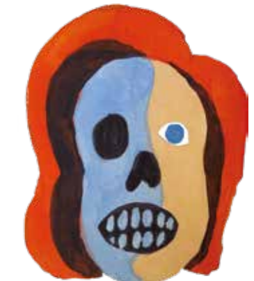
LEYENDA URBANA 3 (2005)