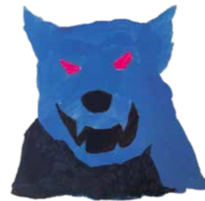
CEMENTERIO VIVIENTE 2 (1992)

Porque más allá de tener en su filmografía una de las mejores adaptaciones de Stephen King, reivindicamos tres títulos con los que Mary Lambert dejó claro que hacer cine directo a vídeo también es una forma de demostrar talento.