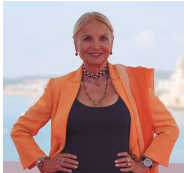
Barbara Bouchet: Premi Nosferatu