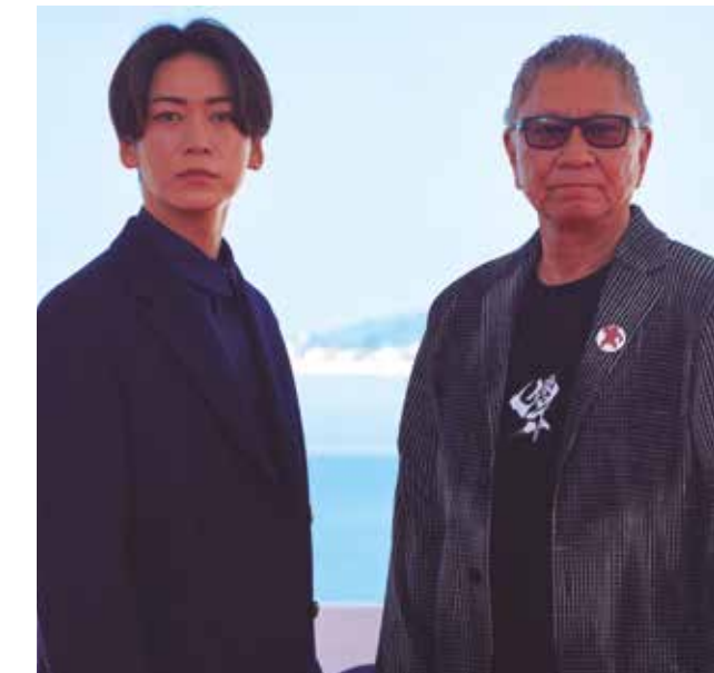
Kazuya Kamenashi i Takashi Miike: Lumberjack the Monster