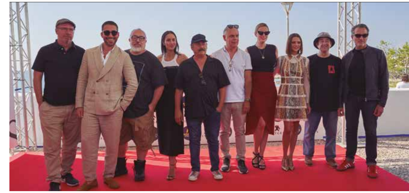
Lequip de 30 Monedas