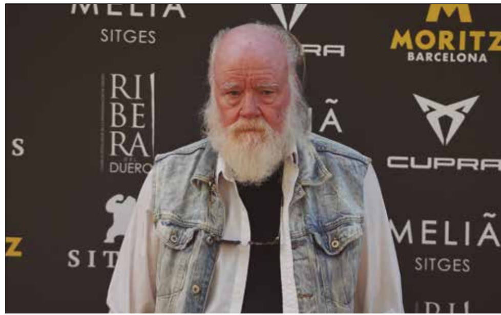
Phil Tippett: Gran Premi Honorífic