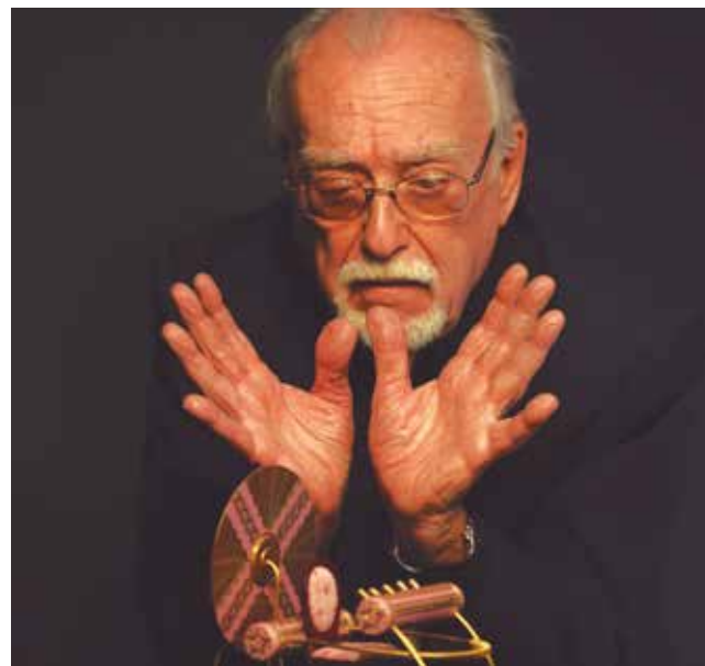
Lamberto Bava: Màquina del Temps