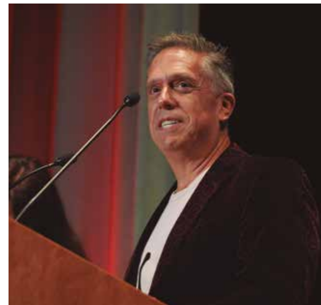
Lee Unkrich: Màquina del Temps