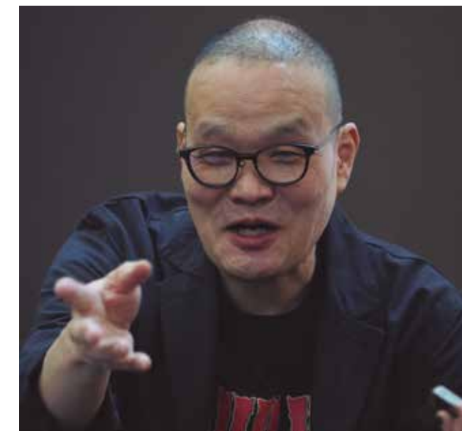
Hideo Nakata: Premi Màquina del Temps