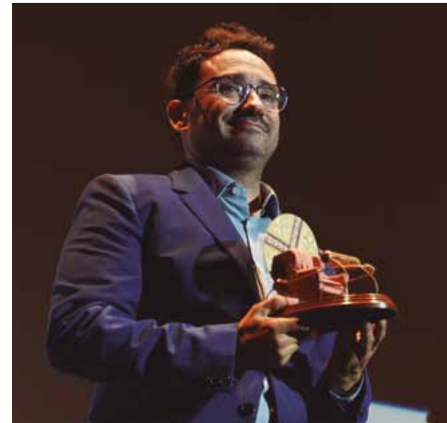
Juan Antonio Bayona: Premi Màquina del Temps