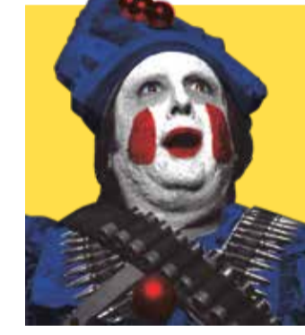
BALADA TRISTE DE TROMPETA (2010)

Brendan Cowles i Shane Khun van escriure i dirigir aquest slasher en clau de comèdia negra plena de gore. En ella, Horny the Clown (potser un dels millors noms d'aquest llistat) és la mascota d'un restaurant de menjar ràpid, el Hella-Burger. Transformat en una espècie de dimoni assedegat de sang i fetge, iniciarà una brutal massacre perseguint als joves protagonistes per tot Orange County.