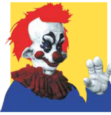
KILLER KLOWNS FROM OUTER SPACE (1988)