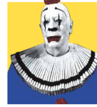
THE CLOWN AT MIDNIGHT (1998)

Festiva reimaginació de La invasió de los ladrones de cuerpos , en la qual uns alienígenes nouvinguts a la Terra es transformen en pallassos per a collir éssers humans... en capolls de cotó de sucre. Creativa, hilarant i més virolada que el pallasso Micolor, aquesta sèrie B de culte és dirigida pels germans Chiodo, coneguts ti-tellaires i artistes d'efectes especials tradicionals.