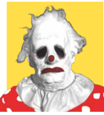
WRINKLES THE CLOWN (2019)

Per a Àlex de la Iglesia, el feixisme no sols produeix monstres sinó, també, desfigurats pallassos assassins. Partint d'una narrativa de rivalitat i venjança entre dos clowns antagonistes ja assajada a Muertos de risa , el cineasta converteix les quatre dècades de la dictadura franquista en un grotesc i sanguinari circ de set pistes on tot és possible: des de Raphael a pallassos que defensen la República a cops de matxet.