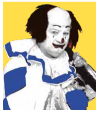
100 TEARS (2007)

Els biopics d'assassins en sèrie molts cops arriben a caure en l'error d'intentar blanquejar o dulcificar la imatge d'aquests. Aquest no és el cas d'aquesta posada en imatges de l'horror que va crear en John Wayne Gacy, pare de família i veí modèlic que treballava com a pallasso a festes infantils, mentre amagava al soterrani i jardí de casa seva les desenes de cossos de nens i joves que va assassinar.