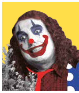
BLOOD HARVEST (1987)

imaginada per Stephen King, podem trobar tota una troupe que res tenen a envejar-li quan es tracta d'assassinar o fer-nos passar una mala estona. Repassem alguns dels pallassos més horripilants sorgits del terror independent. El circ arriba a la ciutat... t'atreveixes a assistir?