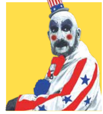
LA CASA DE LOS 1000 CADÁVERES (2003)

Dirigida per Jean Pelleri en plena efer-vescència slasher dels noranta, prenia com a principal referent Pagliacci, òpera italiana escrita el 1892 per Ruggero Leoncavallo. Aquesta era l'excusa per presentar-nos un assassi portant la indumentària i maquillatge de pallasso propi de l'edat moderna, el qual anirà aniquinant als joves que volen posar en actiu l'òpera on va ser assassinada la mare de la protagonista.