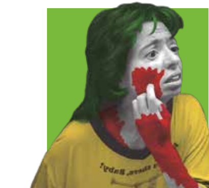
THE OUTSIDE (2022)

Jugant dins del camp dels doppelgänger malignes, en aquesta truculenta història d'animació coreana amb ressons a Perfect Blue , coneixiem a la Ye-ji, una noia que viu acompanyada amb el seu cos. Un dia, es presenta davant d'ella la possibilitat d'aconseguir el pes que desitja: mitjançant una aigua especial, podrà remodelar el seu físic tal com sempre ha volgut. La bellesa acabarà dominant-la i convertint-se en una veritable arma de doble fil. Potser, la pel·lícula d'animació més tèrbola dels últims anys.