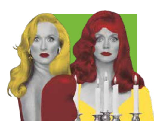
LA MUERTE OS SIENTA TAN BIEN (1992)