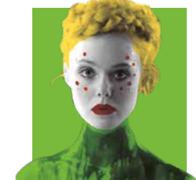
THE NEON DEMON (2016)