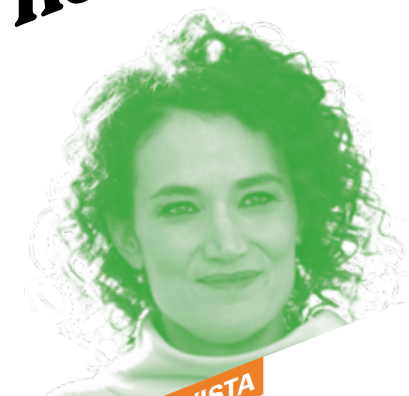
8 ENTREVISTA Coralie Fargeat