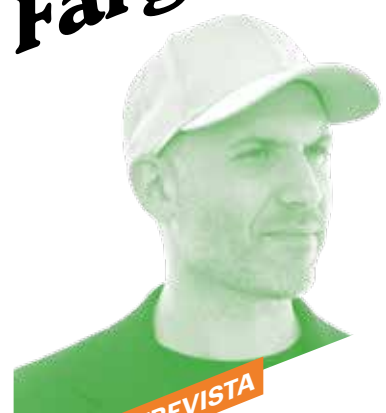
11 ENTREVISTA Damien Leone