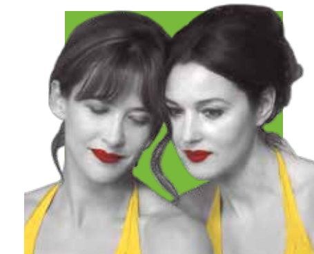
NE TE RETOURNE PAS (2009)

Allò de jugar als doppelgänger és quelcom que la Demi Moore ja havia fet amb anterioritat, ja que fa un temps que s'havia posat a les ordres d'Alain Berliner per aquest drama romàntic amb tints de fantàstic. En ell, l'actriu interpretava a Marie, una vídua que viu a la Provença i que, quan somia, pren la vida de la Marty, una agent literària que viu la seva vida d'èxits a Manhattan, sense deixar gaire clar què és real i què és somni, com si l'univers lynchià entrés de manera estrepitosa al cànon del cinema de tarda.