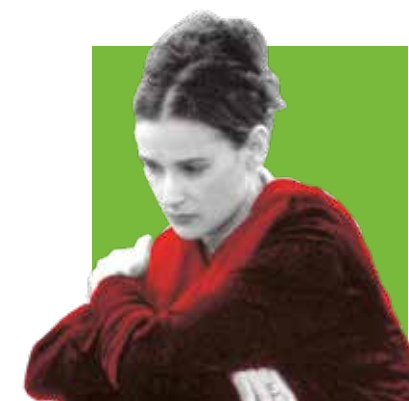
PASIÓN POR VIVIR (2000)

Digueu-me una parella de dones més icònica del cinema fantàstic de principis dels noranta que la de Meryl Streep i Goldie Hawn en aquesta joia slapstick. Dirigida per un Robert Zemeckis en estat de gràcia, dues dones es barllaven per l'amor d'un metge cirurgià insípid (Bruce Willis) i quedaven embriagades pel sex appeal de l'Isabella Rossellini, una espècie de bruixa que els hi donarà a beure una substància de color rosa que els hi donarà la vida eterna... encara que hagin mort de manera salvatge.