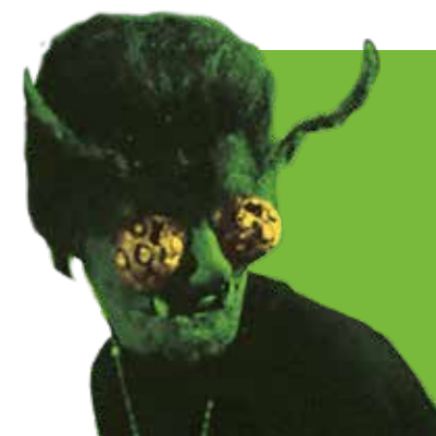
LA MUJER AVISPA (1959)

Si has gaudit de La sustancia , estem ben segurs que no pots perdre't aquests vuit títols envers la bellesa, els doppelgänger i molta truculència.